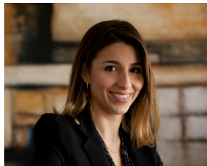
Líderes do Estudo e Fundadores da Virtuous Company